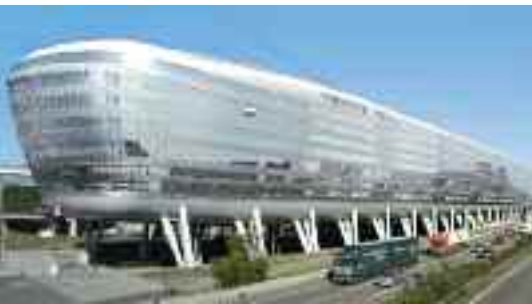
Ein Kreuzfahrtschiff zu Lande: Das Air-rail Center ist 660 Meter lang und 45 Meter hoch.

nicht wagen. Dafür gibt es andere Pläne, die visionär und groß anmuten. Bis ins Jahr 2020 wird der Frankfurter Flughafen zu einer der größten Baustellen Europas. Was heute noch „Frankfurt Flughafen“ heißt, soll mit einer Investitionssumme von 22 Milliarden Euro zu „Airport